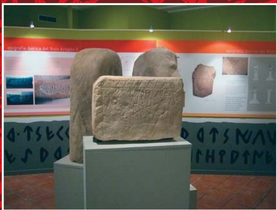
C. I. Ruta de los Iberos de Cretas