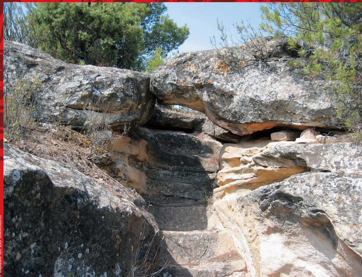
Poblado de Els Castelletts